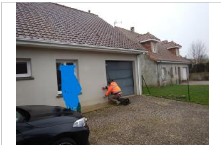
Le site est le mur d'une maison privée.