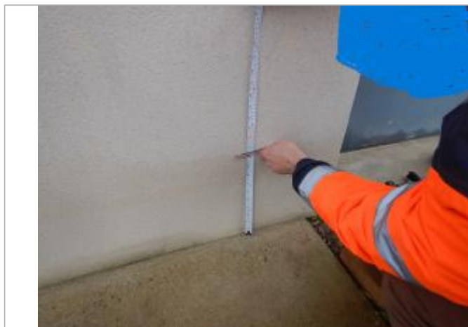
Le repère est sur le mur d'un maison privée.

LE NIVELLEMENT A ÉTÉ EFFECTUÉ PAR LE SYMCÉA, QUI N'EST PAS UN EXPERT GÉOMÈTRE. PAR CONSÉQUENT, LA VALEUR INDIQUÉE EST À TITRE INDICATIF. - 02/02/2024