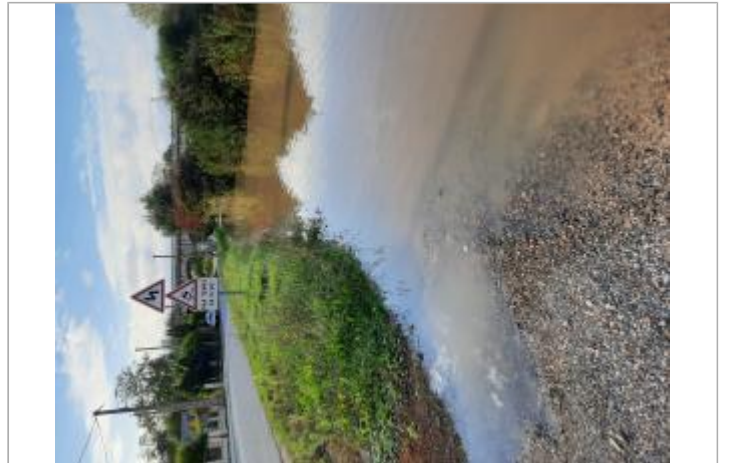
Vue sur la RD 917 et le pont SNCF