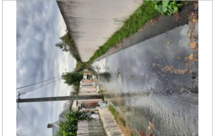
Vue sur l'impasse inondée