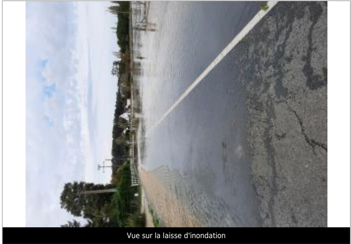
Vue sur la laisse d'inondation