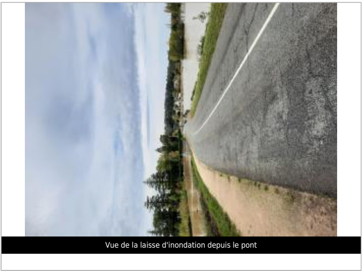
Vue de la laisse d'inondation depuis le pont