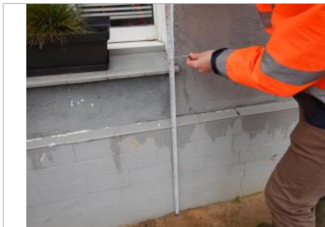
Le repère est localisé sur la baie d'une fenêtre.

LE NIVELLEMENT A ÉTÉ EFFECTUÉ PAR LE SYMCEA, QUI N'EST PAS UN EXPERT GÉOMÈTRE. PAR CONSÉQUENT, LA VALEUR INDIQUÉE EST À TITRE INDICATIF. - 02/02/2024