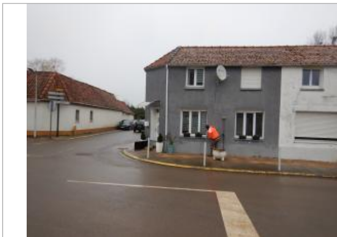
Le site est le mur d'une maison privée.