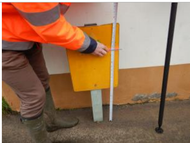
Le repère se trouve sur un panneau routier d'information

LE NIVELLEMENT A ÉTÉ EFFECTUÉ PAR LE SYMCÉA, QUI N'EST PAS UN EXPERT GÉOMÈTRE. PAR CONSÉQUENT, LA VALEUR INDIQUÉE EST À TITRE INDICATIF. - 02/02/2024