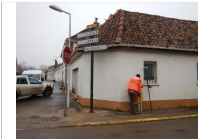
Le site est un panneau routier.