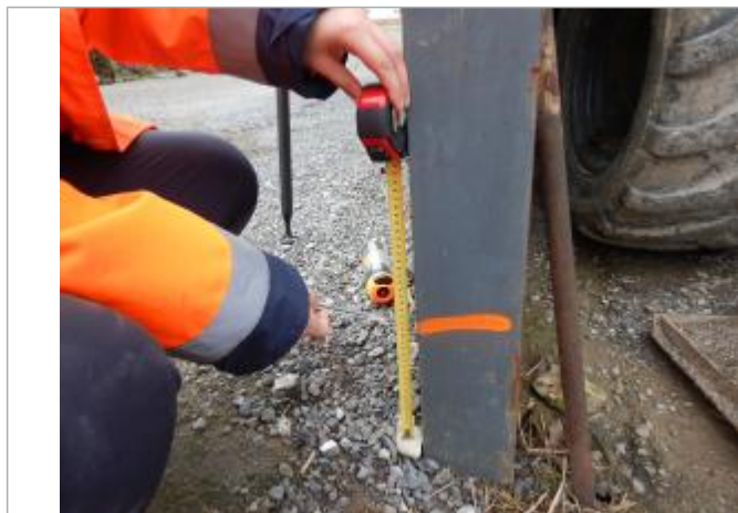
Le repère est au pied du mur d'une étable.

LE NIVELLEMENT A ÉTÉ EFFECTUÉ PAR LE SYMCÉA, QUI N'EST PAS UN EXPERT GÉOMÈTRE. PAR CONSÉQUENT, LA VALEUR INDIQUÉE EST À TITRE INDICATIF. - 31/01/2024