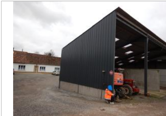
Le site est le mur d'une étable.