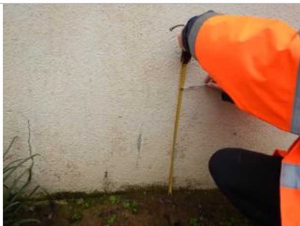
Le repère est au pieds du mur.

LE NIVELLEMENT A ÉTÉ EFFECTUÉ PAR LE SYMCÉA, QUI N'EST PAS UN EXPERT GÉOMÈTRE. PAR CONSÉQUENT, LA VALEUR INDIQUÉE EST À TITRE INDICATIF. - 31/01/2024