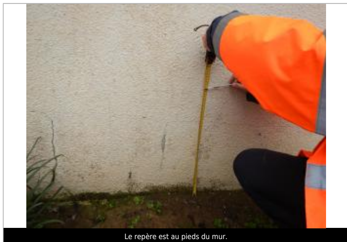
Le repère est au pieds du mur.

LE NIVELLEMENT A ÉTÉ EFFECTUÉ PAR LE SYMCÉA, QUI N'EST PAS UN EXPERT GÉOMÈTRE. PAR CONSÉQUENT, LA VALEUR INDIQUÉE EST À TITRE INDICATIF. - 31/01/2024