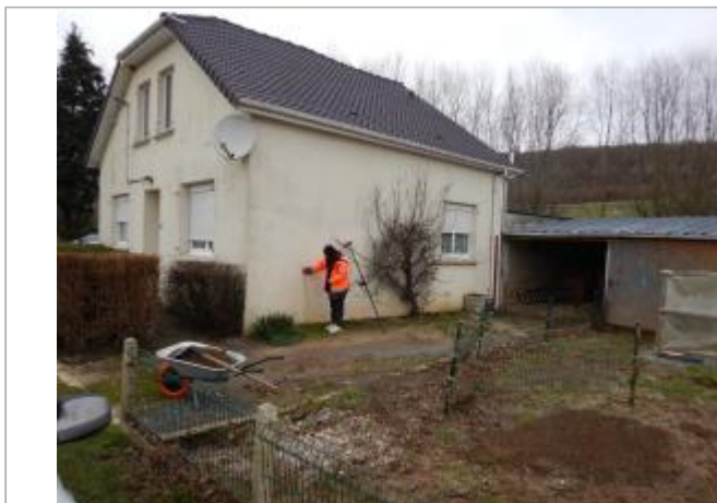
Le site est le mur d'une maison privée.

Coordonnées WGS84 : X: 1.81496104 / Y: 50.58430210