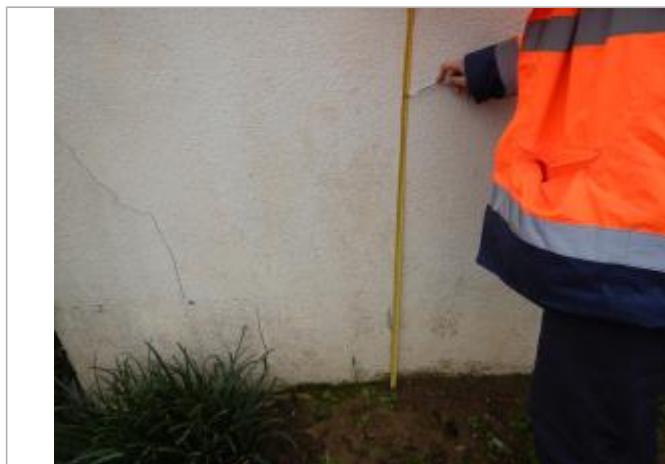
Le repère est sur le mur d'un maison privée.

LE NIVELLEMENT A ÉTÉ EFFECTUÉ PAR LE SYMCÉA, QUI N'EST PAS UN EXPERT GÉOMÈTRE. PAR CONSÉQUENT, LA VALEUR INDIQUÉE EST À TITRE INDICATIF. - 31/01/2024