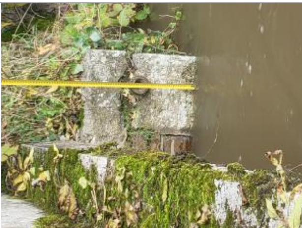
mesure du repère

Altitude calculée de l'eau (en m) : 116.37 m