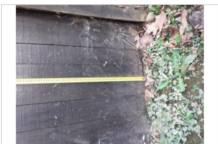
Dépôts sur la porte de garage

MARQUE Maximum de l'inondation : Oui Visibilité : Oui État du repère : Moyen Pérennité : Aucune