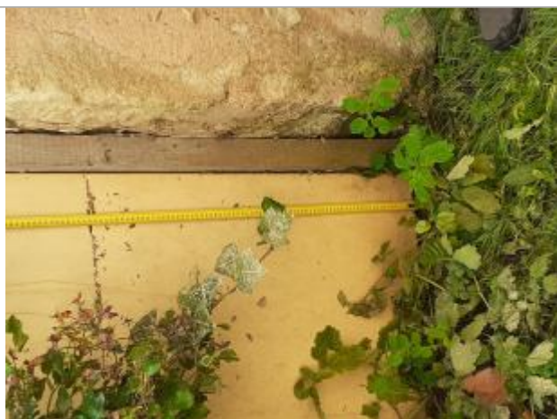
Trace au marqueur

Altitude calculée de l'eau (en m) : 114.89 m