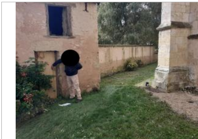
Vue d'ensemble du support