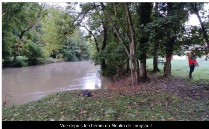
Vue depuis le chemin du Moulin de Longsault.