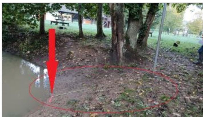
Laisse de crue au sol, à 266 Cm du panneau "Baignade interdite".