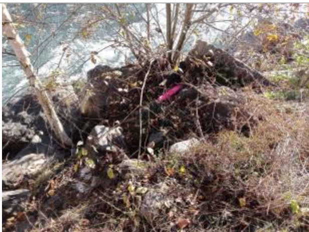
Vue rapprochée du repère.

Altitude calculée de l'eau (en m) : 1104.1089 m