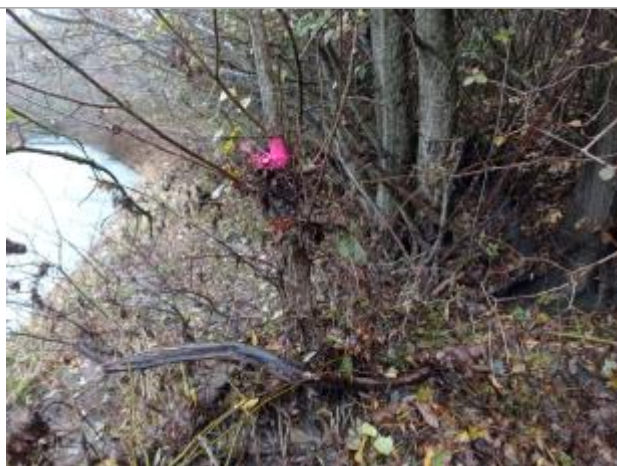
Vue rapprochée du repère.