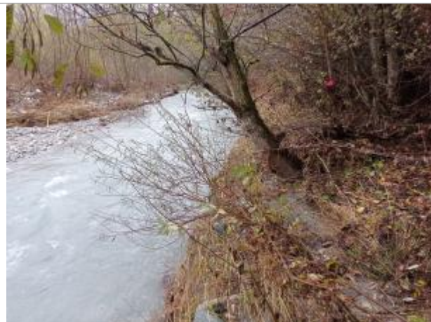
Vue générale du site.

Coordonnées WGS84 : X: 6.00075160 / Y: 44.77720970