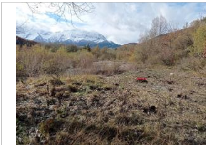
Vue générale du site.

Coordonnées WGS84 : X: 6.05687300 / Y: 44.78141190