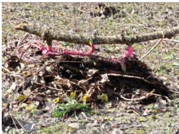
Vue rapprochée du repère.