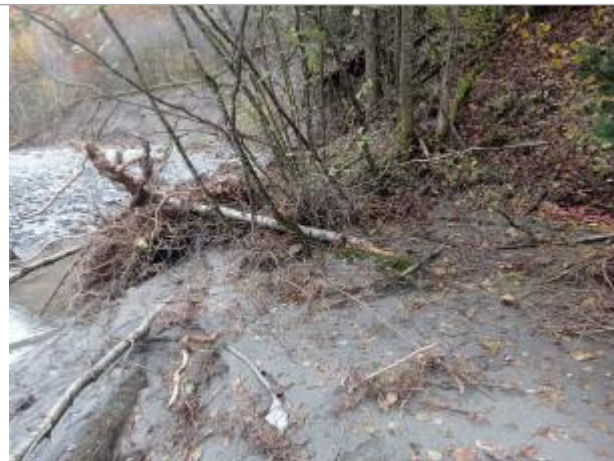
Vue générale du site.

Coordonnées WGS84 : X: 6.11651250 / Y: 44.81196000