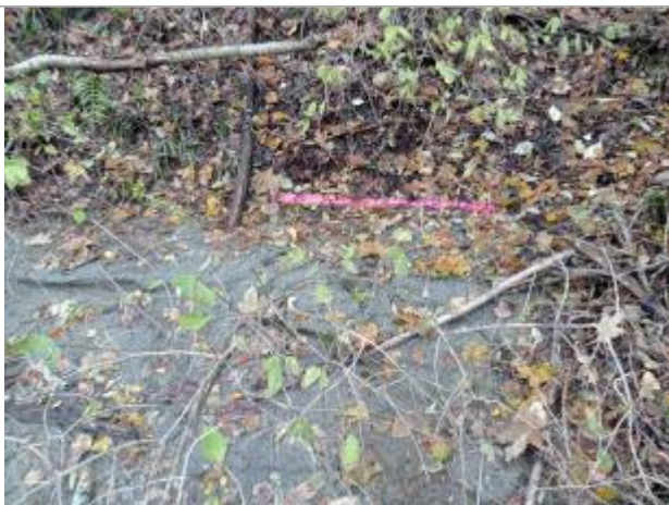
Vue rapprochée du repère.