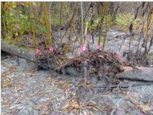
Vue rapprochée du repère.