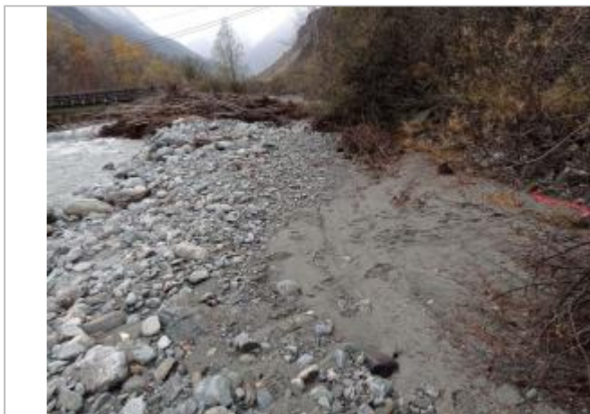
Vue générale du site.

Coordonnées WGS84 : X: 6.20567270 / Y: 44.81964280