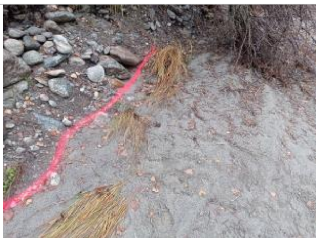
Vue rapprochée du repère.