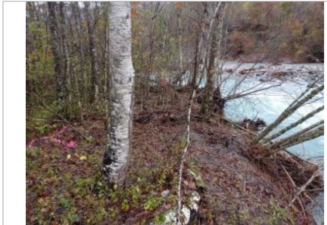
Vue générale du site.

Coordonnées WGS84 : X: 6.03919900 / Y: 44.77742390