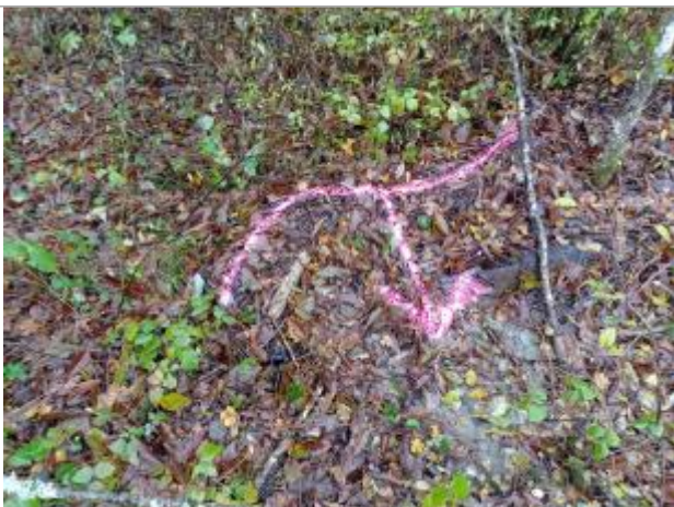
Vue rapprochée du repère.

Altitude calculée de l'eau (en m) : 843.8144