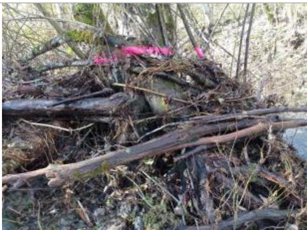
Vue rapprochée du repère.