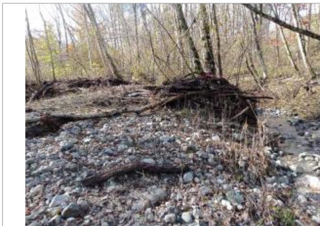
Vue générale du site.

Coordonnées WGS84 : X: 6.05117160 / Y: 44.78019320