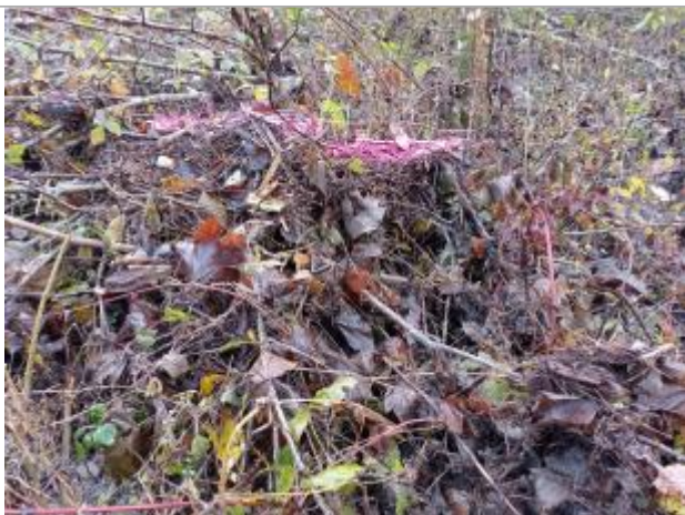
Vue rapprochée du repère.