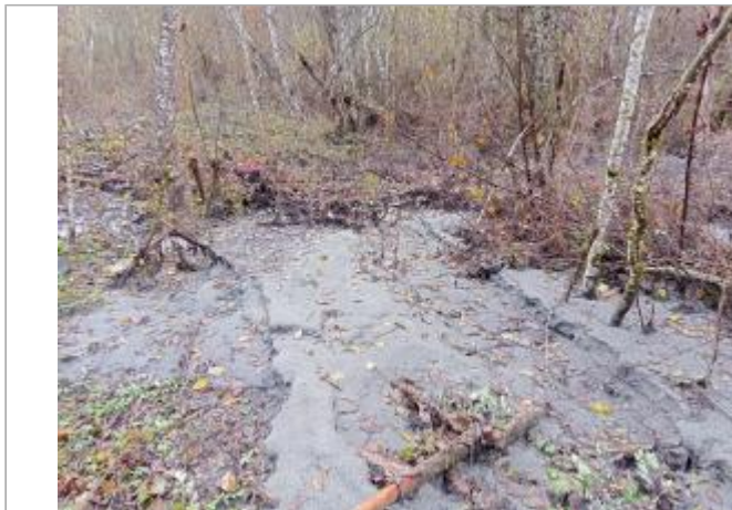
Vue générale du site.

Coordonnées WGS84 : X: 6.06862380 / Y: 44.78565750