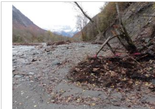
Vue générale du site.

Coordonnées WGS84 : X: 6.08533830 / Y: 44.79581860