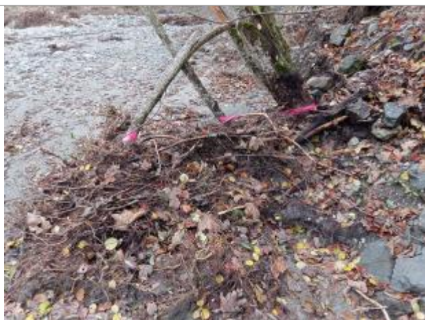
Vue rapprochée du repère.