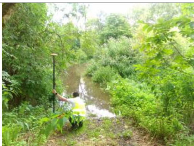
Vue du repère, le 24/06/2024, SPC LACI