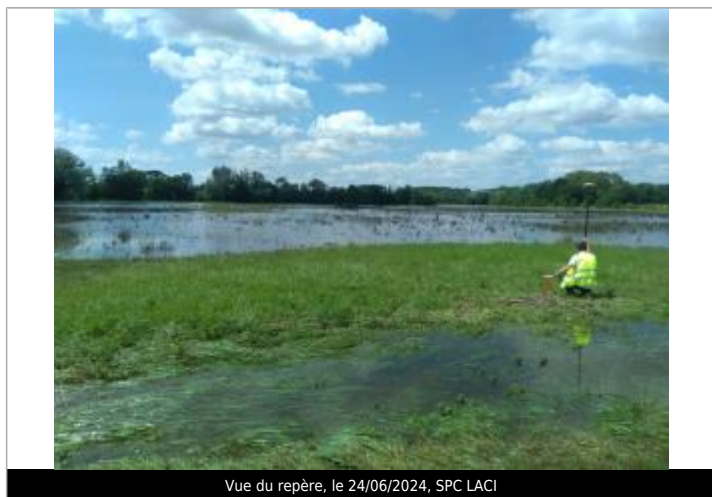
Vue du repère, le 24/06/2024, SPC LACI