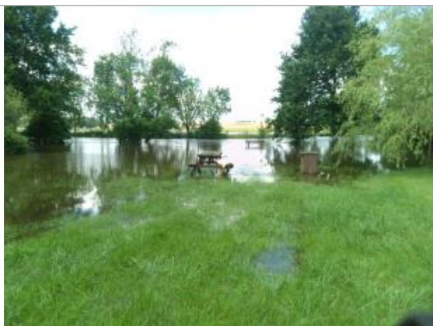
Vue du repère, le 24/06/2024, SPC LACI

Altitude calculée de l'eau (en m) : 116.138 m