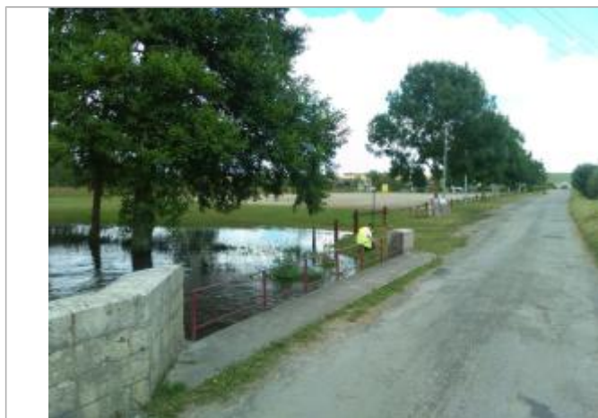
Vue du repère, le 24/06/2024, SPC LACI

SOURCE DE REPÉRAGE : SPC LACI, L'ARNON, CRUE DU 24 JUIN 2024 - 24/06/2024