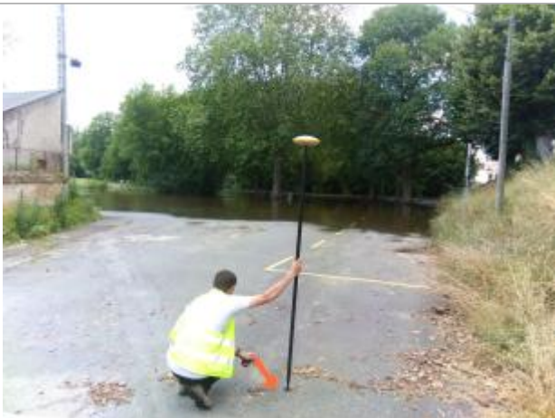
Vue du repère, le 24/06/2024, SPC LACI

Altitude calculée de l'eau (en m) : 122.611 m