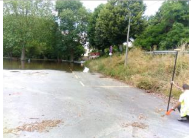
Vue du site, le 24/06/2024, SPC LACI

Coordonnées WGS84 : X: 2.12321800 / Y: 46.99248400