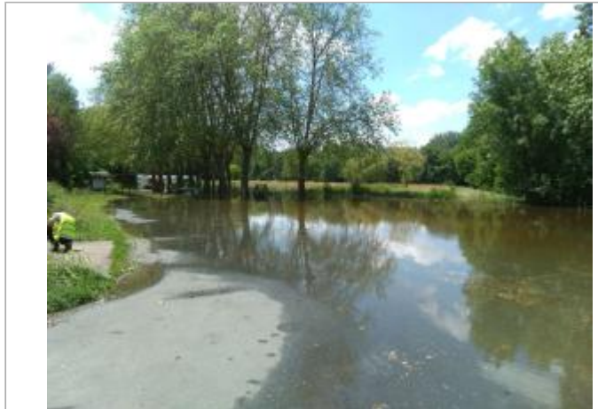
Vue du site, le 24/06/2024, SPC LACI

Coordonnées WGS84 : X: 2.12305500 / Y: 46.99231500