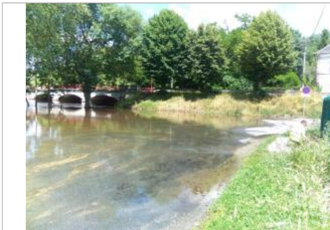
Vue du repère, le 24/06/2024, SPC LACI

Altitude calculée de l'eau (en m) : 122.671 m