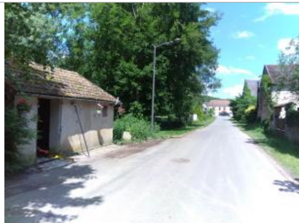
Vue du site, le 24/06/2024

Coordonnées WGS84 : X: 2.11735200 / Y: 46.92980000