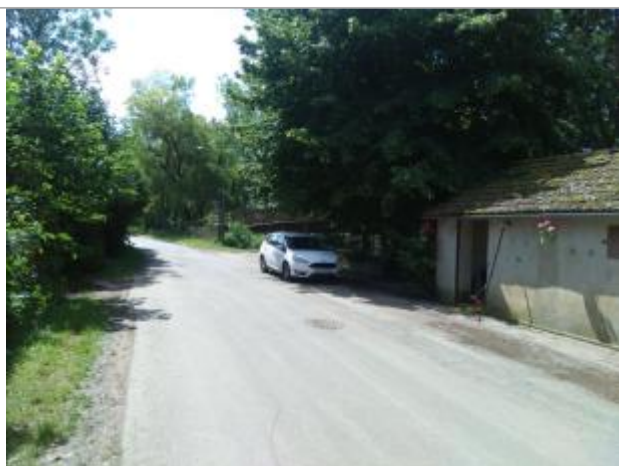
Vue du repère, le 24/06/2024, SPC LACI