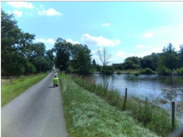
Vue du repère, le 24/06/2024, SPC LACI

Altitude calculée de l'eau (en m) : 133.494 m