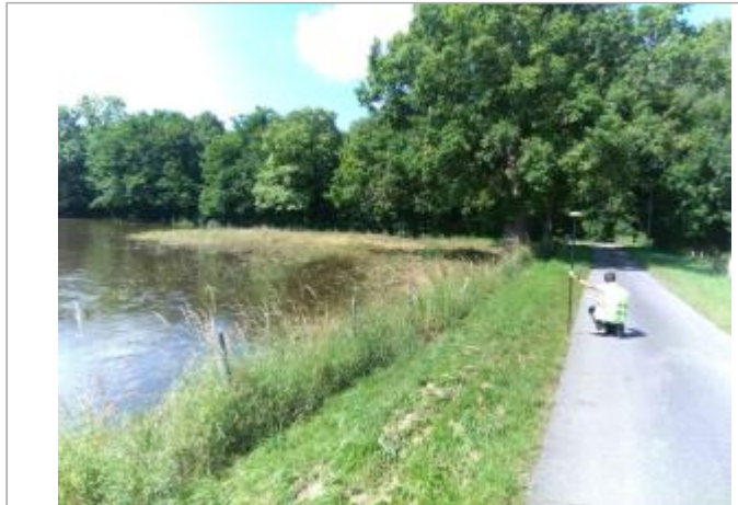
Vue du site, le 24/06/2024, SPC LACI

Coordonnées WGS84 : X: 2.13019600 / Y: 46.90423800