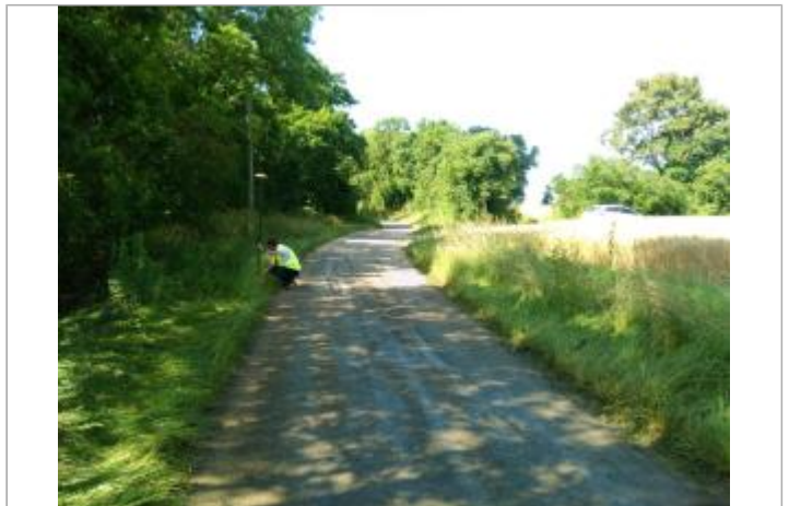
Vue du site, le 24/06/2024

Coordonnées WGS84 : X: 2.13238400 / Y: 46.89634600