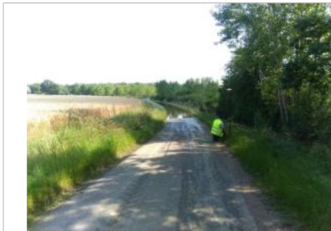
Vue du repère, le 24/06/2024, SPC LACI