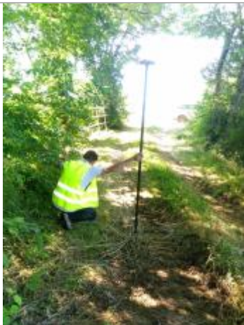
Vue du repère, le 24/06/2024, SPC LACI

Altitude calculée de l'eau (en m) : 136.115 m