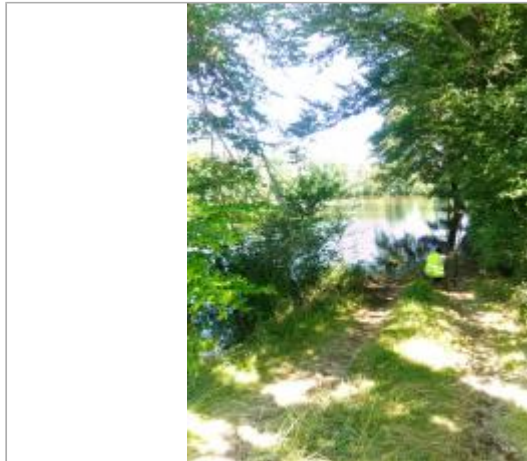
Vue du site, le 24/06/2024, SPC LACI

Coordonnées WGS84 : X: 2.13093200 / Y: 46.88042900