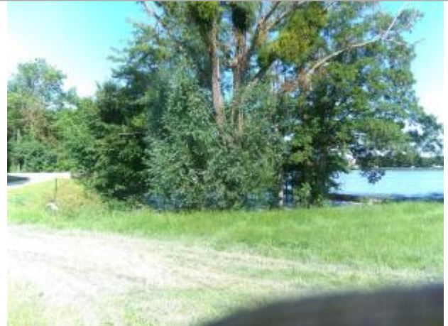
Vue du site, le 24/06/2024

Coordonnées WGS84 : X: 2.15122900 / Y: 46.87725700