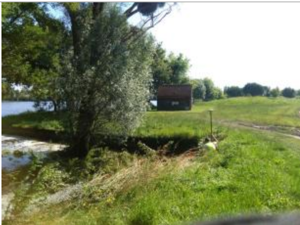
Vue du repère, le 24/06/2024, SPC LACI

Altitude calculée de l'eau (en m) : 138.92 m