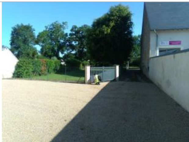
Vue du repère, le 24/06/2024, SPC LACI