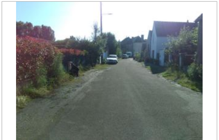
Vue du site, le 24/06/2024, SPC LACI

Coordonnées WGS84 : X: 2.18381400 / Y: 46.75380100