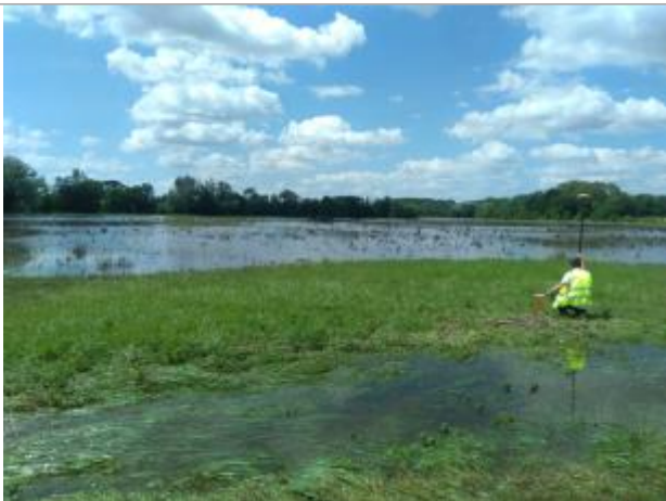
Vue du repère, le 24/06/2024, SPC LACI

Altitude calculée de l'eau (en m) : 115.832