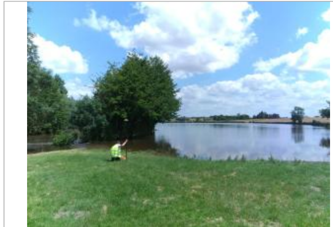
Vue du site, le 24/06/2024, SPC LACI

Coordonnées WGS84 : X: 2.07803000 / Y: 47.00613700