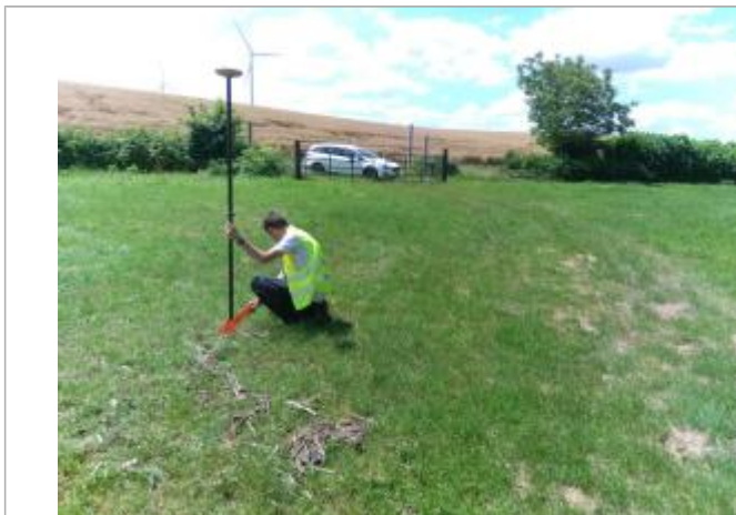
Vue du repère, le 24/06/2024, SPC LACI