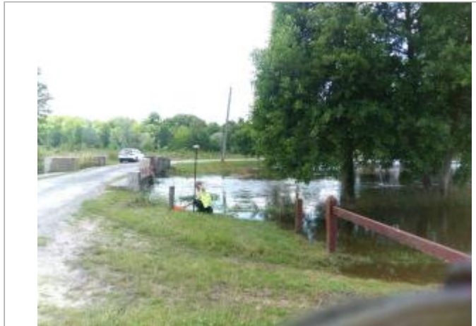
Vue du site, le 24/06/2024, SPC LACI

Coordonnées WGS84 : X: 2.09817900 / Y: 46.99769900