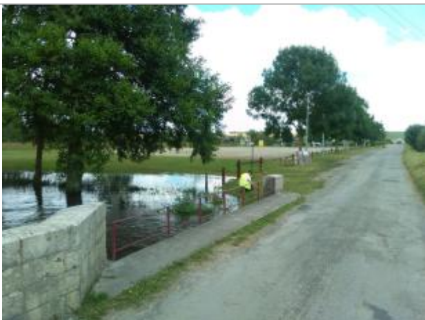
Vue du repère, le 24/06/2024, SPC LACI

Altitude calculée de l'eau (en m) : 120.158