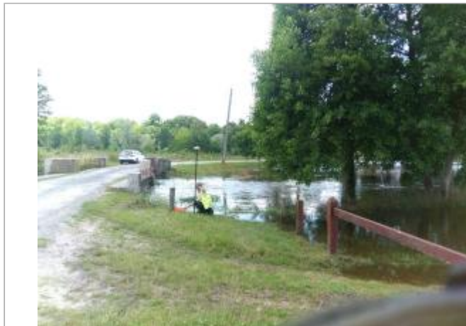
Vue du site, le 24/06/2024, SPC LACI

Coordonnées WGS84 : X: 2.09817900 / Y: 46.99769900