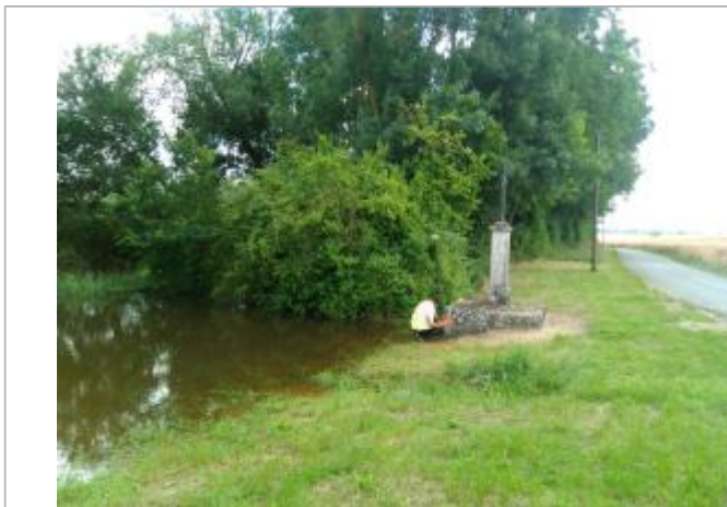
Vue du repère, le 24/06/2024