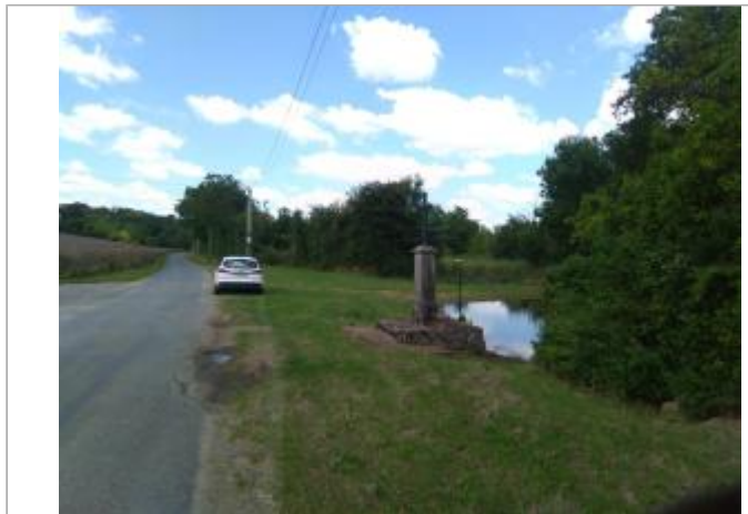
Vue du site, le 24/06/2024, SPC LACI

Coordonnées WGS84 : X: 2.11401000 / Y: 46.98022700