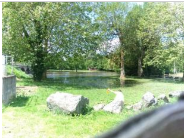
Vue du repère, le 24/06/2024

Altitude calculée de l'eau (en m) : 129.882