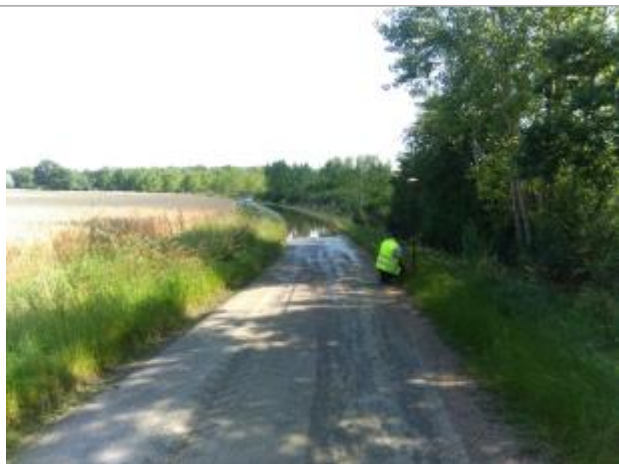
Vue du repère, le 24/06/2024, SPC LACI

Altitude calculée de l'eau (en m) : 134.44