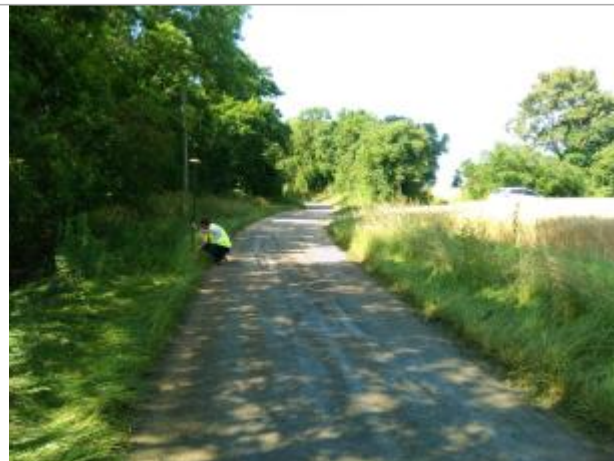
Vue du site, le 24/06/2024, SPC LACI

Coordonnées WGS84 : X: 2.13238400 / Y: 46.89634600