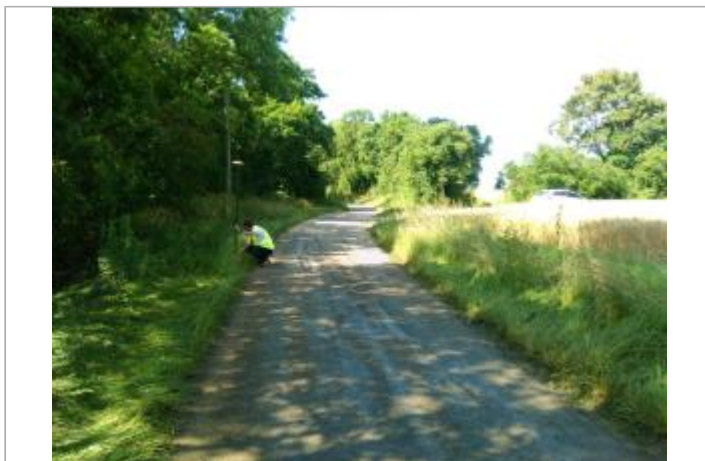
Vue du site, le 24/06/2024, SPC LACI