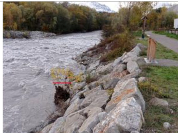
Vue générale du site.

Coordonnées WGS84 : X: 6.07745420 / Y: 44.67229060