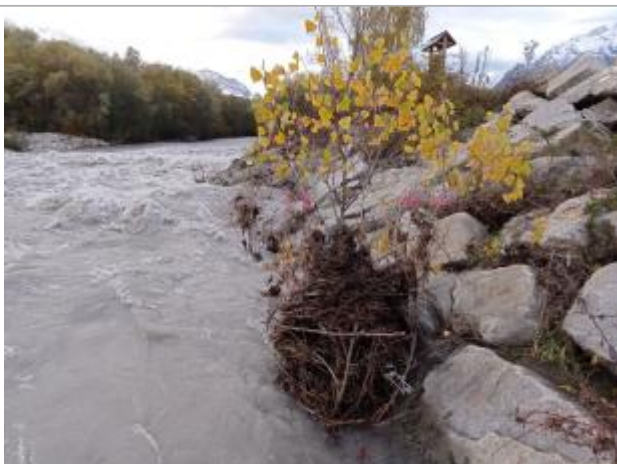
Vue rapprochée du repère.