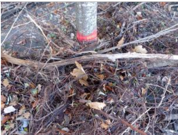
Vue rapprochée du repère.