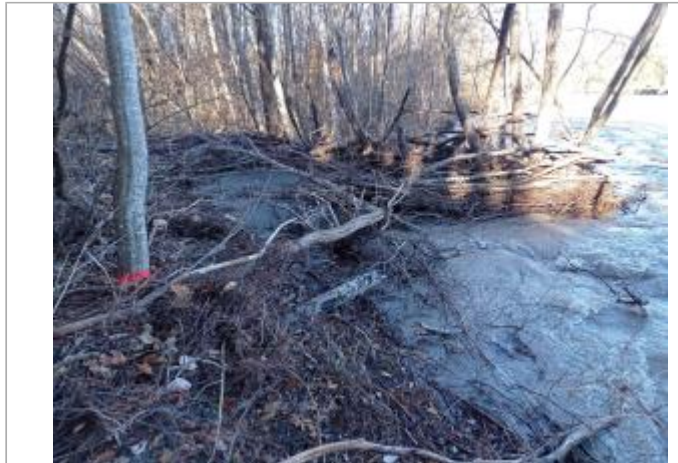
Vue générale du site.

Coordonnées WGS84 : X: 6.12614610 / Y: 44.64789860