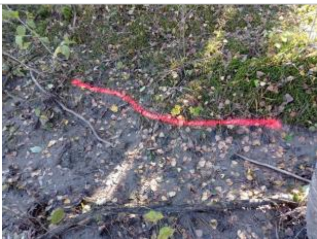
Vue rapprochée du repère.