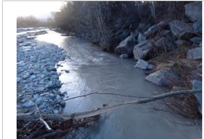
Vue générale du site.

Coordonnées WGS84 : X: 6.17807750 / Y: 44.65112740