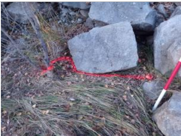
Vue rapprochée du repère.