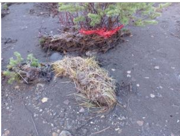
Vue rapprochée du repère.