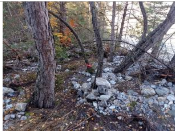
Vue générale du site.

Coordonnées WGS84 : X: 6.27248150 / Y: 44.68520810