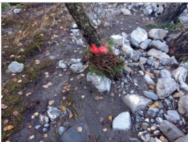
Vue rapprochée du repère.