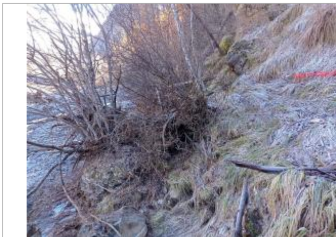
Vue générale du site.

Coordonnées WGS84 : X: 6.33864830 / Y: 44.68538400