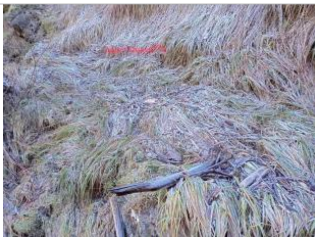
Vue rapprochée du repère.